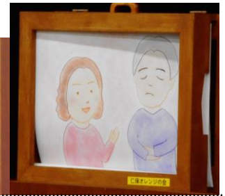
オレンジの会のみなさんによる オリジナル紙芝居上演