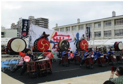
※昨年度の様子です