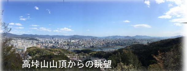
高峠山山頂からの眺望