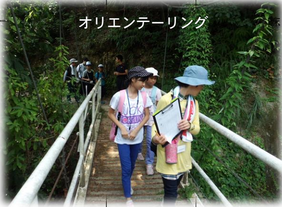
オリエンテーリング