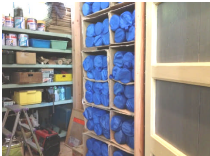
①倉庫にあるヨガマットを受取る