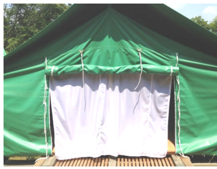
⑤風通しをよくする