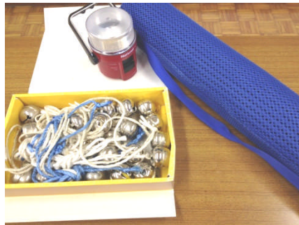
②その他必要物品（ランタン、イノシシよけ鈴）を受取る