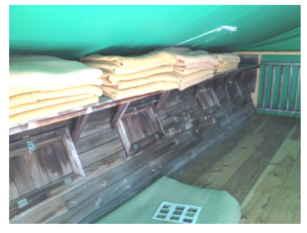
⑥ござを全面に敷き ヨガマットを敷いて寝る

※ヨガマットは、風通しの良いところで干し、もとの袋に収めて事務室に返却してください。