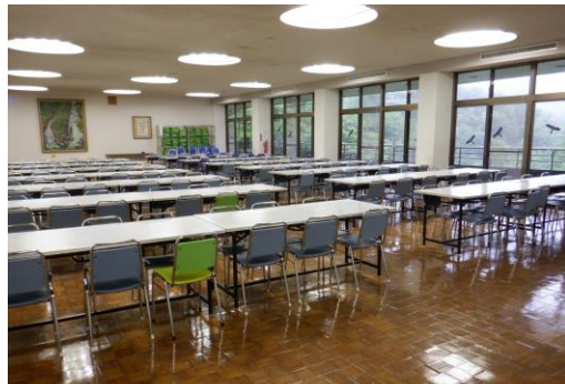
食堂の座席配置も元に戻りました。