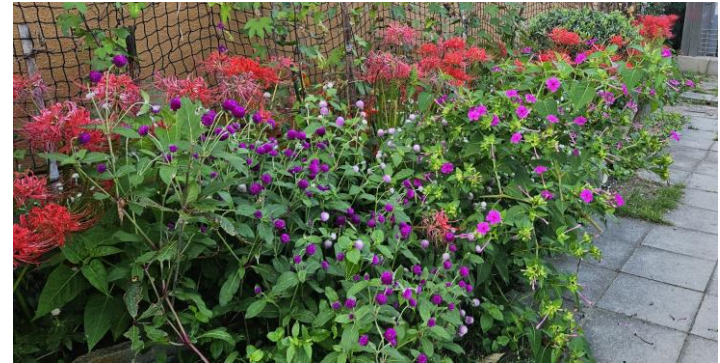
彼岸花（写真上部）、千日紅（写真下部の左半分）