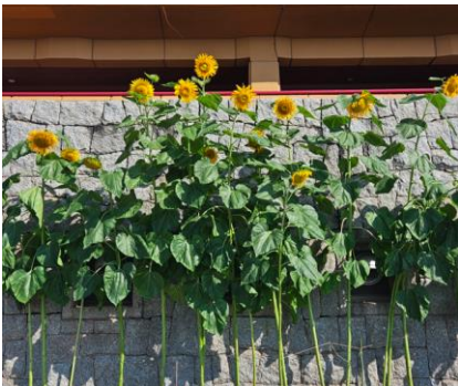
つどいの広場のひまわり

また、三滝少年自然の家の花壇には季節によって、パンジー、ひまわり、彼岸花、マリーゴールド、千日紅、葉ボタン等さまざまな花を植えています。三滝少年自然の家からの景色や植物を、是非、見にいってください。