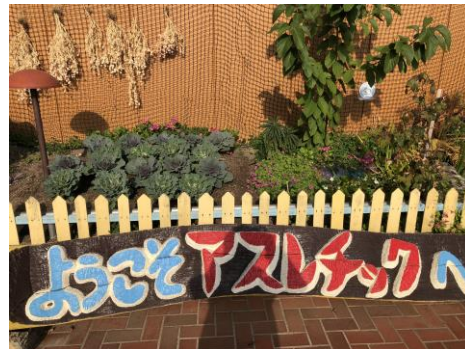
葉ボタン（花壇の左半分）