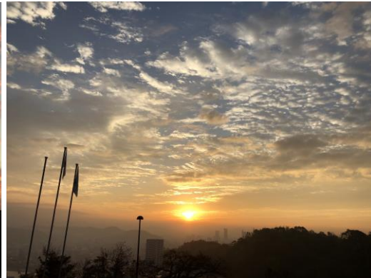
創作テラスから望む朝焼け（写真左）と日の出（写真右）

また、三滝少年自然の家の花壇には季節によって、パンジー、ひまわり、彼岸花、マリーゴールド、千日紅、葉ボタン等さまざまな花を植えています。三滝少年自然の家からの景色や植物を、是非、見にいってください。