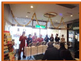
ハンドベルロビーコンサート

昨年12月15日、似島合同庁舎ロビーで、似島中学校音楽部の皆さんによるハンドベルミニコンサートを行いました。「あわてんぼうのサンタクロース」などのクリスマスソングを披露いただき、ベルのきれいな音色に会場のみなさんは、ほっこりされていました。音楽部の皆さん、ありがとうございました。