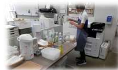
レトロカフェ ホール、キッチン、クイズ、レコード係など