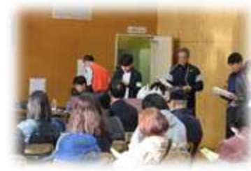
愛らんどフェスタ(公民館まつり) 司会、音響、PC 操作、写真係など