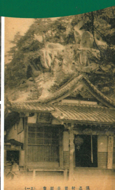
(一) 会観音岩村品温