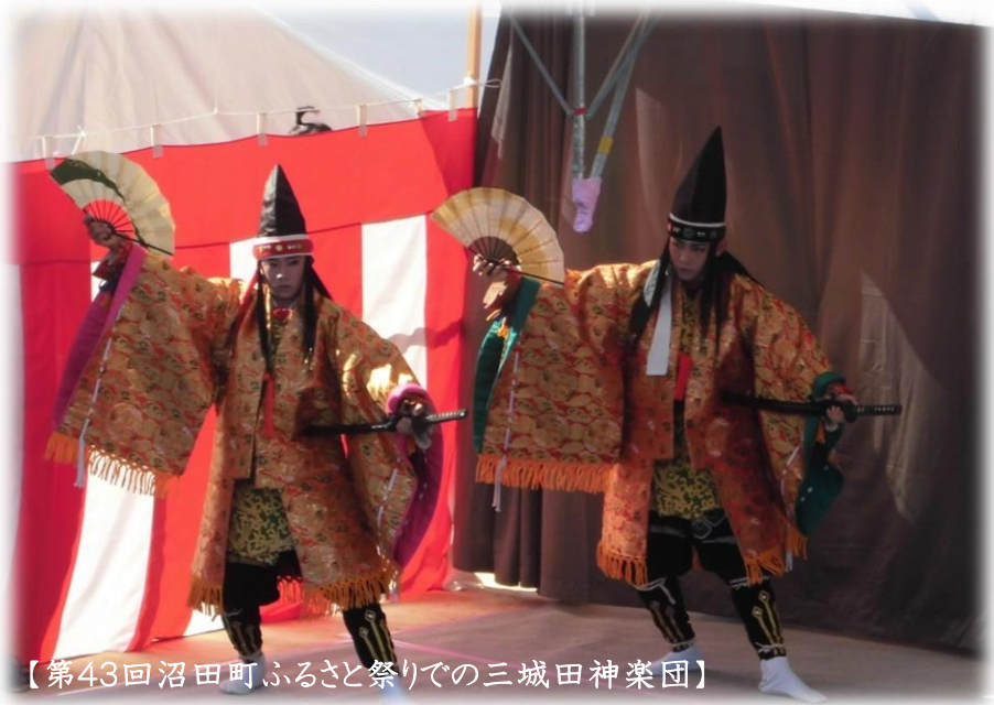
【第43回沼田町ふるさと祭りでの三城田神楽団】