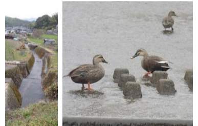
助八(すけはち)さんが寝ていたと思われる木居宅近くの川の浅瀬にたたくむ水鳥の親子

続・大塚村十二景② 大塚村の酒造り その 7 小谷酒店の賑わい ～祝いの酒と酩酊エピソード～