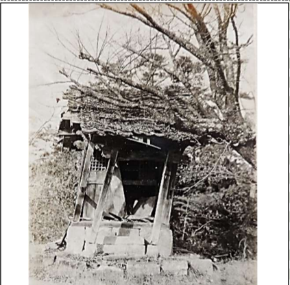
貴重な記録写真を提供いただきました! 昭和23年頃に撮影したと思われる、倒壊寸前の旧横田観音堂の建物です。

大塚の大東地区にある、現在の横田観音堂(大塚東2丁目)は、戦後の昭和28(1953)年に再建されたものですが、以前は随分違った様子だったそうです。