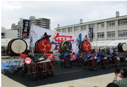
※昨年度の様子です