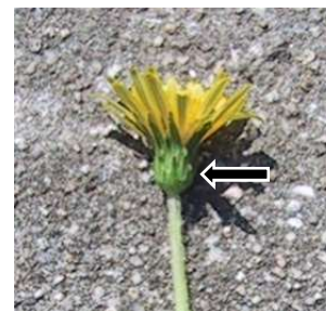
総苞(矢印)が反らない在来種

簡単な在来種、外来種の見分け方は総苞の反り返りです。在来種は反り返りませんが、外来種と在来種の白花は反り返ります。