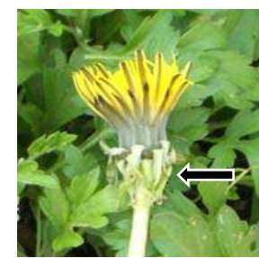
総苞(矢印)が反り返る外来種