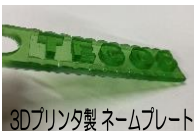
3Dプリンタ製ネームプレート

新型コロナウイルスの感染拡大防止のため、主催事業に定員を設けています。必ず事前申込みのうえご参加ください。