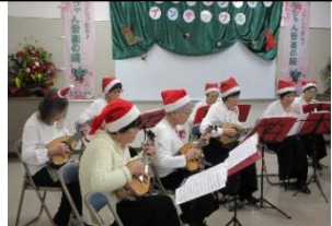
↑ギターとマンドリンの演奏