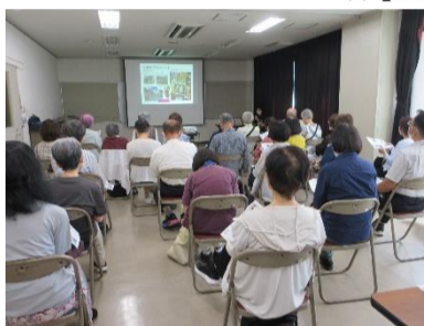
↑今年度の様子(ローカル線を楽しもう)