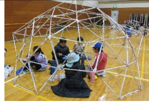
↑フラードームづくり