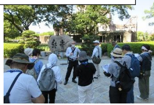
↑原爆ドーム前(本川地区周辺へ)