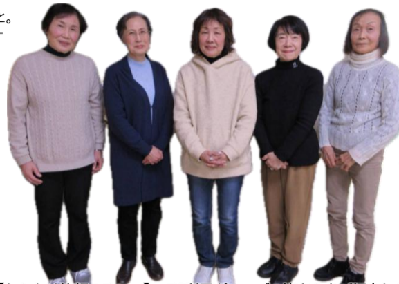
【わかたけ笑顔のリレー】 「さいほう箱」(パッチワーク)

▼お申込みは特に記載のあるものを除き、発行月の最初の開館日(裏面にて休館日をご確認ください)から電話または窓口でお願いします。▼特に記載の無いものは、原則会場は竹屋公民館、参加費は無料、定員がある場合は先着順です。▼高齢者いきいき活動ポイント対象事業は のマークが目印です。ポイント手帳をお持ちの方はご持参ください。▼お申込みの際にお寄せ頂いた個人情報は、事業運営の目的以外には使用いたしません。▼体調不良の方は参加をご遠慮ください。▼手指の消毒等、感染症対策にご協力ください。