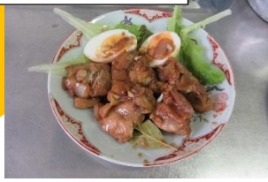
↑フィリピン料理の調理実習