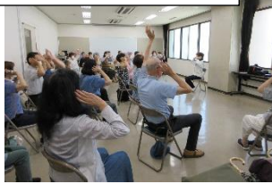
↑音楽に合わせて椅子ダンス