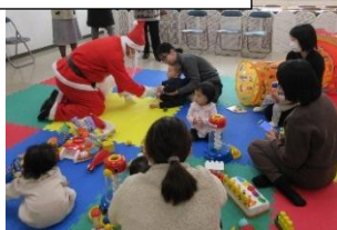
↑子育てオープンスペースのクリスマス会