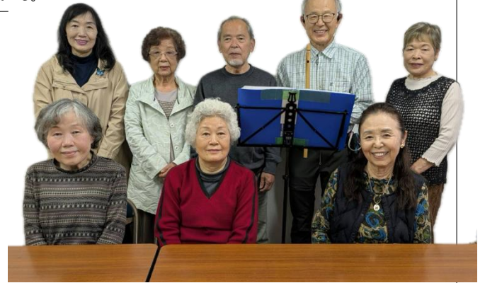
★【わかたけ笑顔のリレー】では利用グループの皆さんをご紹介します！