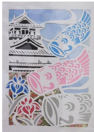
「山下芳雄さんの切り絵作品展」も開催！ 展示期間：第1弾 5/9(土)~5/30(土) ※6月に第2弾展示も開催予定