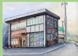
【画：利松スケッチサークル】

発行：(公財)広島市文化財団 利松公民館 住所：広島市佐伯区利松一丁目18-15 TEL928-8687・FAX928-0868 E-mail toshimatu-k@cf.city.hiroshima.jp HP： http://www.cf.city.hiroshima.jp/toshimatu-k/