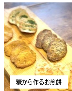
糠から作るお煎餅

※申込期限を過ぎてキャンセルの場合は、参加費を頂きます。※料理講座では食物アレルギー対応はしていません。