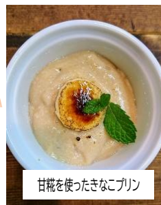
甘糰を使ったきなこプリン