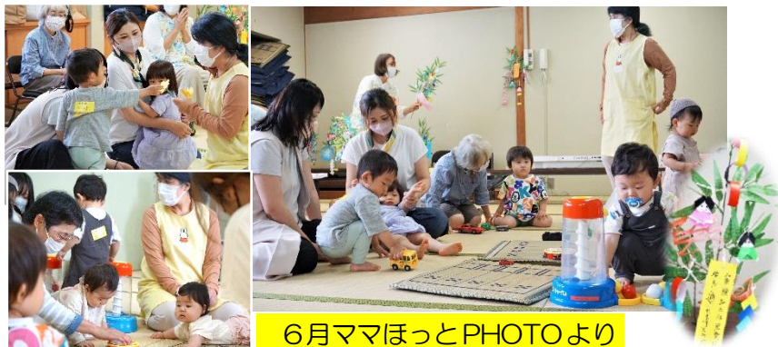
6月ママほっとPHOTOより