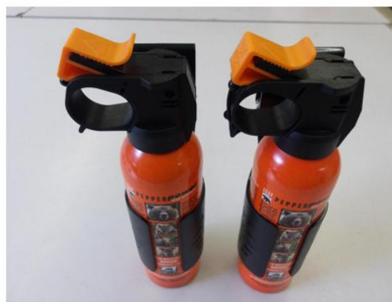
カプサイシンスプレー