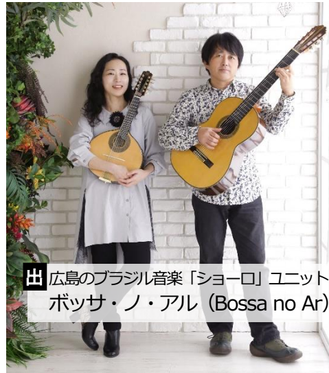
出 広島のブラジル音楽「ショーロ」ユニット ボッサ・ノ・アル (Bossa no Ar)

多くの地域からの移民たちによって多種多様な音楽が生まれているブラジル。大変珍しいブラジルの弦楽器「10弦バンドリン」と深い音色の「7弦ギター」の演奏で、南の国の音楽とリズムをお届けします。