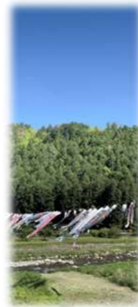
風にはためく麦谷(国原)地区の鯉のぼり